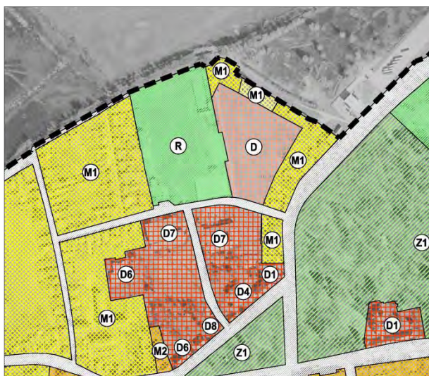
URBANISTIČKI PLAN UREĐENJA NASELJA DONJI MIHOLJAC ("Službeni glasnik", broj 09/08, 02/12, 08/15, 07/18 i 06/20 - pročišćeni tekst) kartografski prikaz broj 1. "KORIŠTENJE I NAMJENA POVRŠINA"

Odredbes za provedbu Urbanističkog plana uređenja naselja Donji Miholjac ne mijenjaju se.