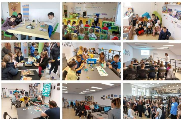
Slika 4. Radionice i posjeti knjižnici

LJETO U KNJIŽNICI – Potaknuti odazivom djece na radionice u sklopu Perivoja knjiga, odlučili smo organizirati Ljeto u knjižnici. Tijekom cijelog ljeta djeca su dolazila u knjižnicu na radionice. Utorkom i srijedom imali smo radionice slaganje lego kockica, a četvrtkom društvene igre za djecu i roditelje.