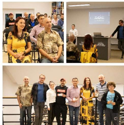
Slika 5. Lov na fotke

LOV NA FOTKU - Projekt "Lov na fotku" knjižnica je provodila u suradnji s udrugom za razvoj civilnog društva Migra Donji Miholjac. U sklopu projekta je proveden natječaj ( https://gkgdm.hr/lov-na-fotke-2025/ ) koji je bio koncipiran tako da sudionici pronađu motive Donjeg Miholjca te ih fotografiraju. Sudionici su popunjavali online obrazac nakon kojeg su putem elektroničke pošte dobili pravila i naputke za uploadanje fotografija. Po prijavi su dobili link, korisničko ime i lozinku za pristup cloud servisu na koji su uploadali do maksimalno 5 svojih najboljih fotografija, koje smo prosljedili žiriju na ocjenjivanje. Jednu od fotografija sudionici su nazvali "facebook". Nakon isteka roka za uploadanje fotografija, skupili smo sve fotografije naziva facebook te napravili album koji smo objavili na Facebook profilu knjižnice. Fotografija koja je skupila najviše "lajkova" dobila je nagradu publike.