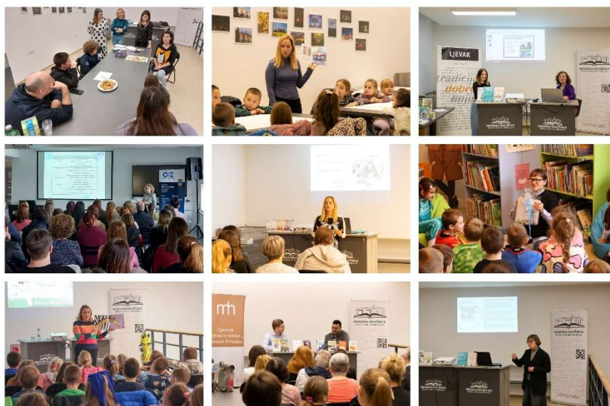
Slika 1. RASTimo uz priču

PERIVOJ KNJIGA - Ove godine održali smo po peti put Perivoj knjiga, manifestaciju koja se održava pod pokroviteljstvom Ministarstva kulture i medija, Osječko-baranjske županije te Grada Donjeg Miholjca. Ovogodišnja događanja održana su u prostoru knjižnice, koja je na nekoliko dana postala pravo središte književnosti, kreativnosti i druženja. Imali smo čast ugostiti izuzetne autore: Hrvoja Šalkovića, Igora Beleša, Miru Morovića i Marinu Vujčić. Organizirali smo četiri radionice koje su bile ispunjene smijehom, igrom i učenjem. Jednu radionicu osmislio je i vodio naš knjižnični tim, a u ostalima su nam se pridružili dragi gosti: ekipa iz STEAM centra Osijek, predstavnice SOS Dječjeg sela iz Ladimirevaca te Obiteljskog centra, Područne službe Osječko-baranjske. Svaka radionica bila je posebna i donijela nešto novo, bilo da se radilo o znanosti, emocijama, timskom radu ili stvaranju vlastitih priča.