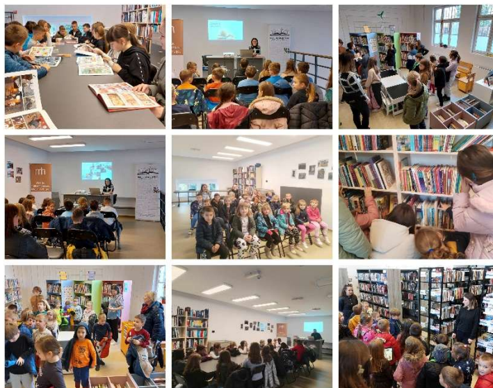
Slika 5. Mjesec hrvatske knjige 2025.

STRUČNA USAVRŠAVANJA – tijekom 2025. godine knjižničari su sudjelovali na konferencijama, okruglim stolovima te dostupnim seminarima/webinarima.